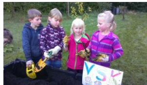
„Was wächst denn da in unserem Beet?“