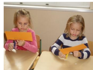
Auch beim Basteln herrscht volle Konzentration!