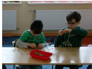
Wir experimentieren mit geometrischen Körpern!