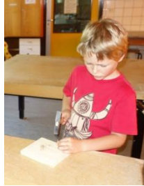
Wir bauen ein Geobrett!